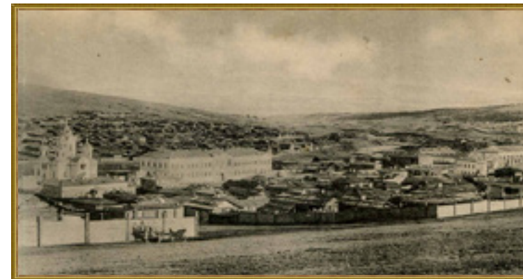
Город Кяхта. Открытка из серии «Виды Забайкалья». Начало XX в.

Европу чай попал в эпоху первых географических открытий. Привезённые мореплавателями пачки чая вызывали недоумение у кухарок, не умеющих обращаться с новым продуктом. Случались курьёзы, когда хозяйки подавали на стол распаренные чайники, предлагая их жевать гостям, а саму заварку за не-