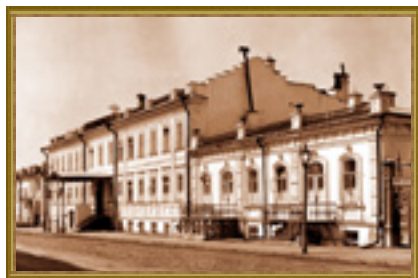
Симбирское коммерческое училище

Но со временем это стало для него духовной потребностью. Трудно назвать более-менее крупное начинание в Симбирске рубежа веков, которое в той или иной мере не опиралось