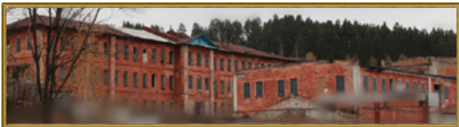
Румянцевская сукодная фабрика (Барышский район). Современное фото

Например, один из первых асфальтовых заводов России, устроенный в 1873 году под