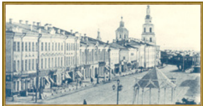
Фрагмент улицы Большой Саратовской от пересечения с Дворцовой улицей до пересечения с улицей Чебоксарской. Доходные дома купцов Буско (ныне ул. Гончарова, № 38), Конурина/Свейникова (№ 36), Красниковых (№№ 34, 32). Открытка нач. XX в. (с фото 1880-х гг.)

Вдоль улиц города тянулись ряды витрин и вывесок. К началу XX века большинство крупных торговцев заменили старые деревянные лавки «каменными магазинами с обширными подвалами и складами». Многие прекрасные здания по улице Гончарова (тогда Большой Саратовской, в 1912 году переименована в Гончаровскую), в которых и сегодня идет бойкая торговля, достались Ульяновску в «наследство» от симбирского купечества. Эта улица уже в те годы была главной улицей города, поэтому здесь размещалось множество магазинов, в том числе представительства знаменитых столичных и зарубежных торговых фирм, таких как чайное товарищество «Василий Перлов с сыновьями», всем известная компания «Зингер» (ныне ул. Гончарова, № 19), музыкальный магазин Волкова и Яковлева – представительство фирмы «Беккер» (№ 12), «Магазин мехов. Торговый дом П.Б. Шетинкин в Казани» (№ 36), один из первых симбирских автомагазинов конторы «Товарищество», представлявшей «завод братьев Стевер» (№ 13).