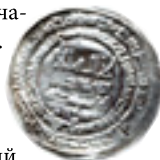
Монета Волжской Булгарии

История Симбирской земли, как и история её предпринимательства началась задолго до основания Города-крепости Симбирск Богданом Хитрово. Первые города и экономические центры на территории нашей области стали зарождаться в IX-X вв. во время расцвета торговли и ремёсел Булгарского периода нашей истории. Именно вдоль основного торгового маршрута того времени - реки Волга (Идель) и торгового пути из Киева в Великий город и стали закладываться основные экономические и торговые центры Поволжья. Крепкие купеческие традиции, основные маршруты продви-