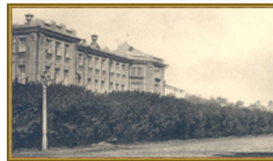
Фрагмент улицы Большой Саратовской с бульваром. Открытка нач. XX в.