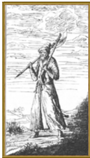
Стрелец. Рисунок Эрика Пальмквиста. 1674 г.

Соль в те годы занимала важное место в городской торговле. В Симбирске пересекались соляные потоки с Нижнего и Среднего Поволжья, Урала и Прикаспия. Почти сразу после окончания строительства крепости на берегу Волги были выстроены соляные амбары как казённые, так и отдельных торговых людей. Из города за солью в Астрахань снаряжались специальные речные суда с высокими набитыми бортами, крытым грузовым трюмом, называемые насадами. Соль привозили в Симбирск. Здесь находился крупнейший в стране соляной двор, в нём складировалась и хранилась соль, поступавшая затем на государев обиход, патриарший двор, в монастыри и амбары крупных промышленников. По зимнему пути в город приезжали за солью отовсюду, в том числе и из столичного града Москвы.