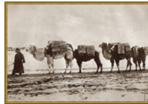
Караван с чаем из Кяхты

История появления этих продуктов на нашем столе полна легенд и пикантных подробностей. Считается, что чай начали употреблять около пяти тысяч лет тому назад в Китае. Именно китайцам принадлежит идея заваривать листочки с чайного куста – растения из рода камелий. Полученный ими напиток, придающий бодрость и укрепляющий силы, долгое время оставался тайной для других народов. От китайцев секрет чая узнали жители Индии и Японии. В