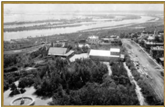
Владимирский сад в Симбирске. Начало XX века