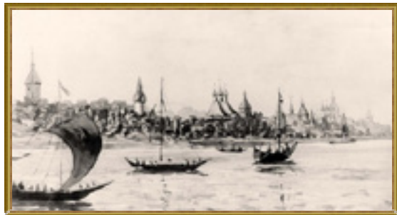
Торговые суда на Волге

В вывозной торговле господствовали хлеб и сукно. Суконное производство было в губернии поставлено на широкую ногу. Правда, предпочитали выпускать самую дешёвую, грубую материю и продавать её государству. Зато, каждый третий солдат Российской империи маршировал в шинели из симбирского сукна. Немалую долю урожая хлеба местные купцы приобретали у помещиков и крестьян и частью продавали в городе, частью отправляли баржами вверх и вниз по Волге. Но, увы, многие здешние торговцы вплоть до середины XIX века ленились тащить хлеб иногородним купцам, а уж те наваривали неплохие барыши на нашем хлебушке. Симбирский губернатор Егор Николаевич Извеков в 1859 году сетовал: «Ограниченное развитие торговой деятельности местных купцов происходит от недостатка предприимчивости...».