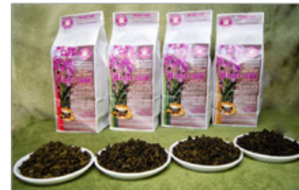
Копорский чай. Современное фото.