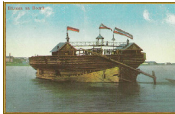
Беляны - уникальные суда XIX века