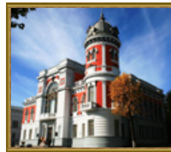
Дом-памятник И.А. Гончарову