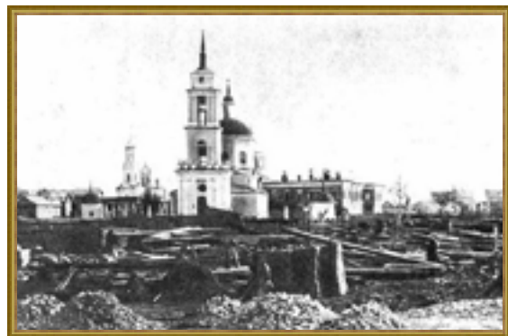
Симбирск после пожара 1864 года

Сборная приносила городу главный доход, и симбирские власти всячески о ней заботились. Ужасный пожар, бушевавший в Симбирске с 13 по 21 августа 1864 года сжёг дотла все ярмарочные постройки. Но уже в феврале следующего года среди обугленного города радовал глаз «совершенно отстроенный новый, значительно обширнее прежнего, ярмарочный гостинный двор, состоящий из 16 корпусов, в котором помещалось 436 номеров лавок». К слову