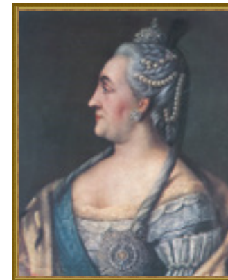
Портрет Екатерины II

Мясников же остался в Симбирске. В центральной части города у него был большой кирпичный, роскошно обставленный дом, ничем не уступавший столичным дворцам. В нем, самом просторном и богатом доме Симбирска, останавливалась Екатерина II во время своего непродолжительного пребывания в городе летом 1767 года.