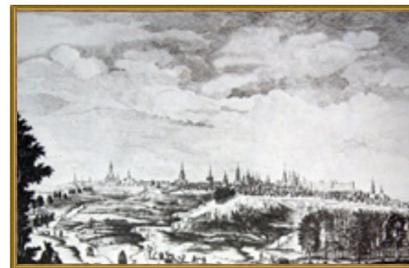
Вид Симбирска с юго-запада. Гравюра П.А. Артемьева с рисунка М.И. Махаева по материалам натурных зарисовок экспедиции полковника А.И. Свечина. 1765 г.

В одно время с сооружением кремля к югу от него велось строительство Спасского женского монастыря, а внизу под горой на берегу Волги – Успенского мужского монастыря.