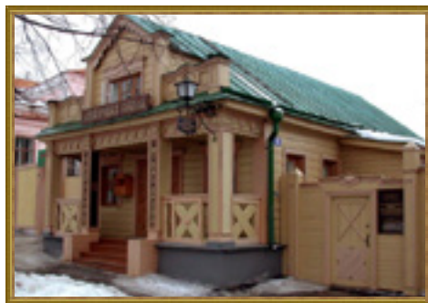
Музей «Мелочная лавка» (ул. Ленина, 76). Современное фото

Широко была распространена мелочная торговля, ассортимент товаров которой зашкаливал за сотню. Эти небольшие частные лавочки находились при домах хозяев и были разбросаны по всему городу. У мелочных лавок складывалась постоянная клиентура, а товары частенько отпускались в кредит. По улице Ленина в доме № 76, где когда-то бойко