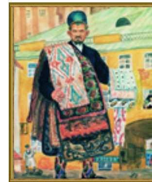
Б. Кустодиев. Торговец коврами.

Хранением, учётом и сертификацией товара ведал мытный двор. За каждый воз с шерстью и кожами, мёдом и воском, мясом и рыбой, «белыми и чёрными грибами» в доход города платили по утверждённой городской управой таксе. Однако городские мужи так увлеклись взвинчиванием платы, десятилетиями капитально не ремонтируя лавки, что торговцам пришлось пригрозить им фактическим бойкотом ярмарки. Лишь после того, как на сукно управского стола легло заявление от 53 купцов о том, что дожди через ветхую крышу подпортили их товар, власти раскошелились. В 1896 году заблестели краской четыре новых торговых корпуса. В первом открылась пользовавшаяся наивысшим спросом «модная линия», второй отвели под оптовую торговлю, в третьем и четвёртом корпусах продавали чай, сахар, свечи, тульские самовары и всевозможную «мелочь», столь необходимую в хозяйстве. На специальных козлах вывешивали церковные колокола – здесь монополию держали самарские негоцианты. Отдельные площадки отводились под торговлю деревянными изделиями, кустарной продукцией и конями. За всем зорко следил ярмарочный комитет.