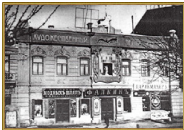
Доходный дом Зеленковых. Начало XX века

Вывеска «Фруктовая торговля» указывает вход в подвальное помещение дома. С 1908 года верхний этаж дома занимал художественный театр (кинематограф) «Модерн».