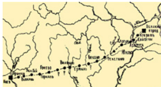
Торговый путь из Киева в Булгар

жения торговли, ставшие основой для дальнейшего развития Симбирской предпринимательской инициативы, были заложены и протерены знаменитыми на весь средневековый мир ремесленниками и купцами Сембера, Кайбелл, Арбути, Кокряти, Карсуна, Канадея, Калмаюр, Ундор и многих других городов-ремесленников, городов-купцов.