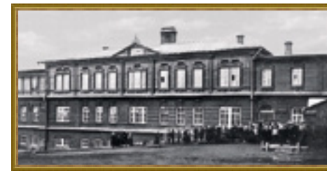
Центральное здание Симбирской чувашской школы. 1908.

В то же время, купечество, играя всё большую роль в жизни края, вынуждено было прозябать на вторых ролях. Привилегированное положение занимало симбирское дворянство. К местным помещикам «прилепилось» обидное прозвище – «дворянин с мухой в ноздре». Большей частью разорившееся, не слишком знатное, но непомерно кичливое симбирское дворянство не давало развернуться деловым людям. Немало бюрократических препон чинили и администраторы всех уровней. Поэтому многие из симбирских купцов были настроены весьма оппозиционно к существующим порядкам. Алексей Павлович Балакирщиков в годы 1-й русской революции был одним из издателей газеты левого направления «Симбирские Вести». В приятельских отношениях был он с одним из основателей симбирской группы РСДРП Юрием Александровичем Кролюницким. Другой лидер симбирских большевиков – Василий Васильевич Орлов – сам был купеческим сыном. Симбирский губернатор Александр Степанович Ключарёв с большим подозрением поглядывал на местное купечество, «безусловно поддерживавшее своими капиталами революцию».