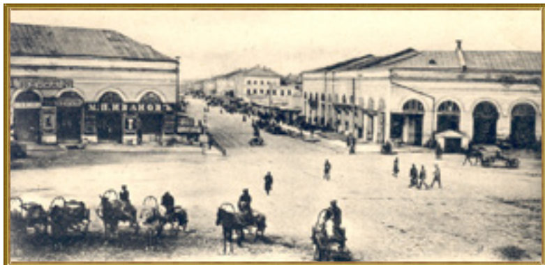
Торговые ряды в Симбирске – «Столбы»

«Столбами» в просторечье называли Гостиный двор с арочными галереями, располагавшийся полукругом на перекрестке улиц Большая Саратовская и Дворцовая. Здание было построено в 1832-1836 годы по проекту петербургского архитектора Авраама Ивановича Мельникова (1784 – 1854).