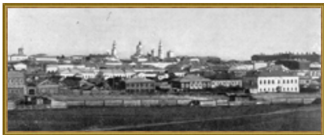
Ярмарочная площадь. Открытка нач. XX в.

А в конце того же века о такой роскоши приходилось только мечтать. В то время Симбирская ярмарка напоминала заурядный базар и проводилась лишь в июле (Казанская). За те три дня пока она длилась, население Симбирска увеличивалось на треть. Мужички приценивались к «колесам, бочкам, кадкам, дрянью, лубью». Плотами пригонялся лес. Лошади, коровы, бараны приходили своим ходом, порою аж с Оренбургских степей. На судах привозили «разную ценную и глиняную посуду, лимоны, апельсины и прочие плоды, которые в рассуждение здешнего климата родиться не могут». Местные садоводы и огородники выкладывали свой урожай. Но далеко было этой торговле до Карсунской Троицкой ярмарки. И старший брат Симбирска – уездный Карсун долго оставался ярмарочным центром губернии.